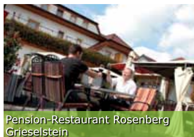
Pension-Restaurant Rosenberg Grieselstein