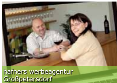
hafners werbeagentur Großpetersdorf

Seit September 2010 sind die Fördertöpfe nunmehr ausgeschöpft. Finanzielle Mittel stehen erst dann wieder zur Verfügung, wenn zugesagte Förderungen nicht in vollem Umfang in Anspruch genommen werden und dadurch reservierte Gelder wieder frei werden.