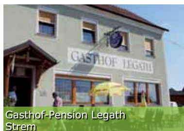
Gasthof-Pension Legath Strem