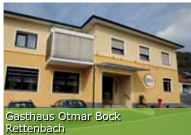
Gasthaus Otmar Bock Rettenbach