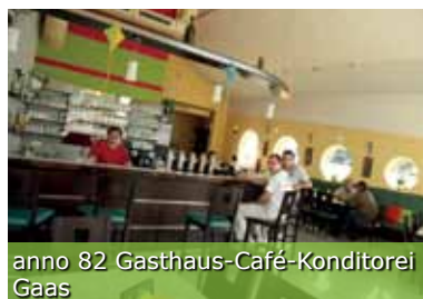
anno 82 Gasthaus-Café-Konditorei Gaas